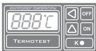
Рис.1 Передняя панель прибора.

Система автоматически определяет подключен датчик к прибору или нет, а также обрыв или короткое замыкание в датчике или соединительных проводах. В этом случае на индикаторе появляются три черточки по середине (- - -) и блокируется работа коммутирующего элемента (реле). Аналогичная ситуация возникает если температура датчика опускается ниже минус 60 °С или повышается выше 250 °С.