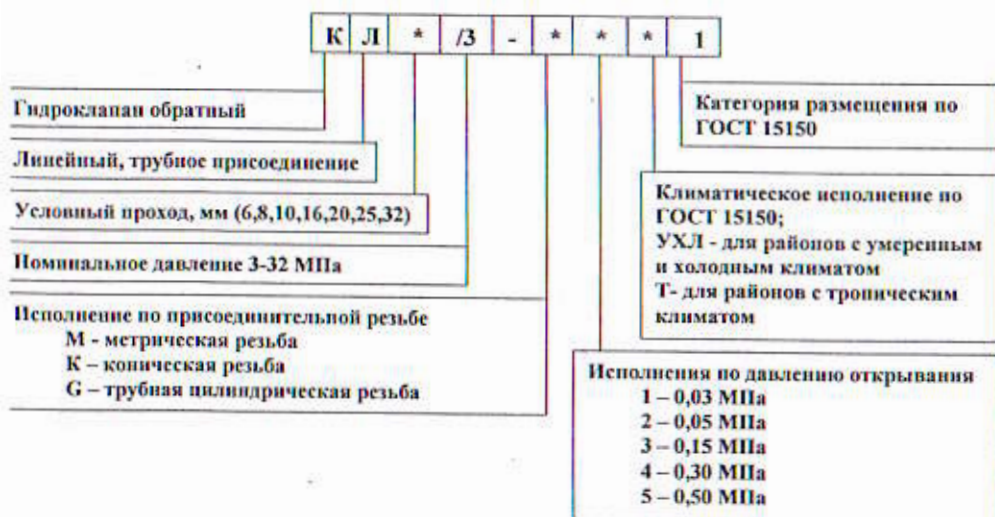
Рисунок 1- структура условного обозначения