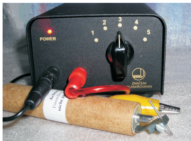
Электроискровой карандаш модели ES-150Z