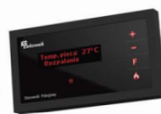
НОВИНКА!!! комнатная панель